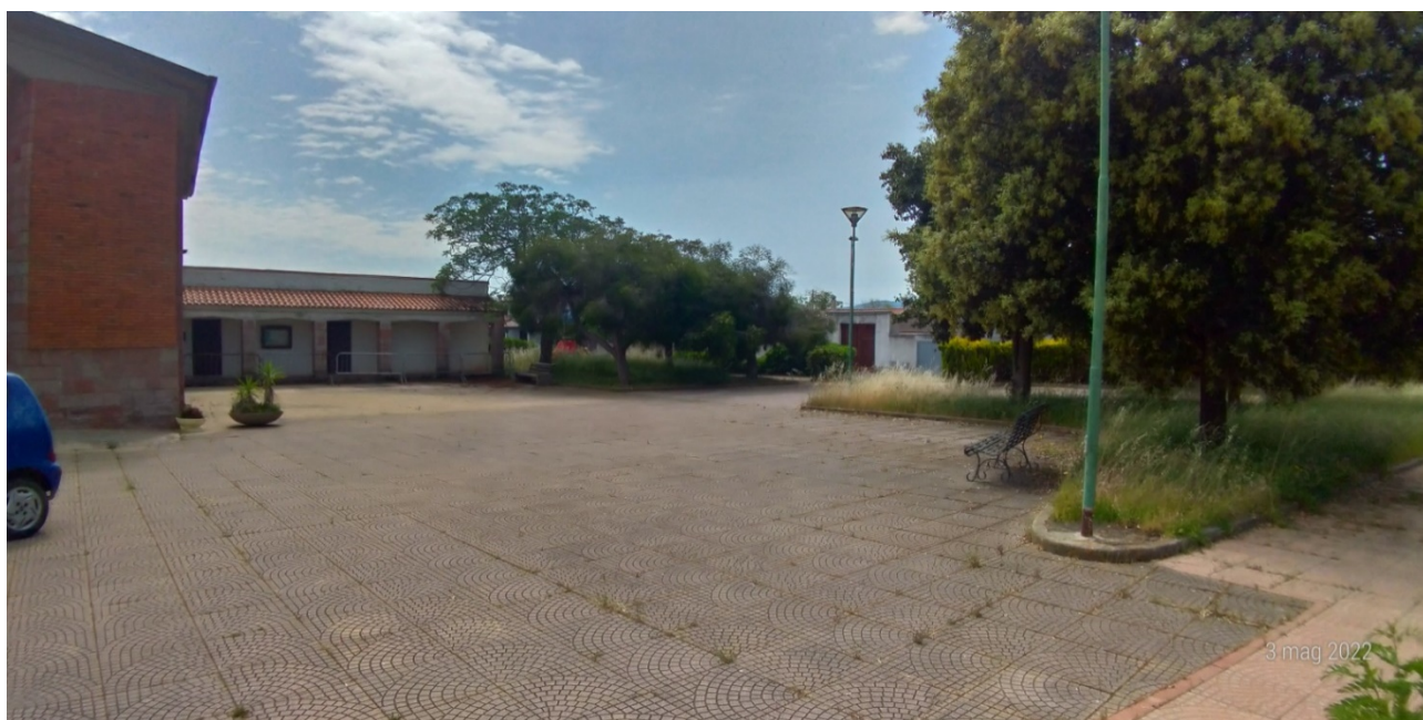
Vista panoramica zone d'intervento