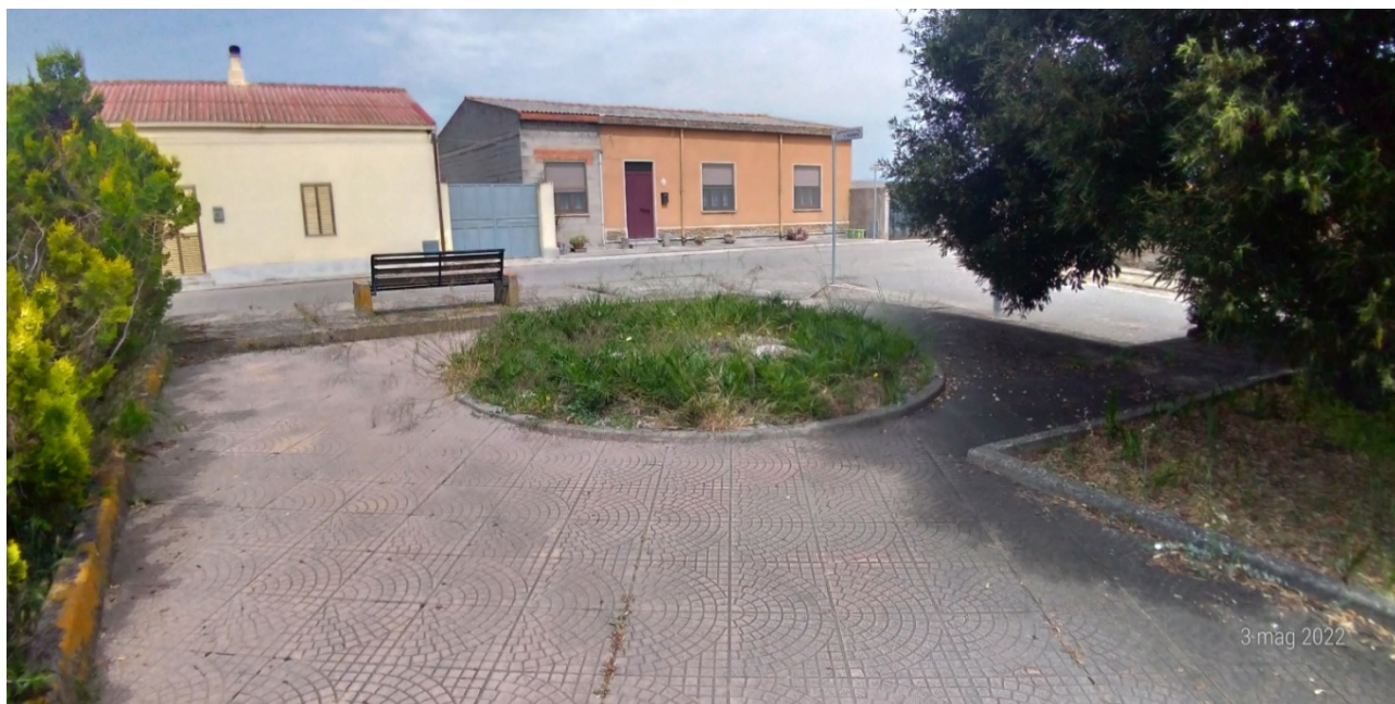
Vista panoramica zone d'intervento